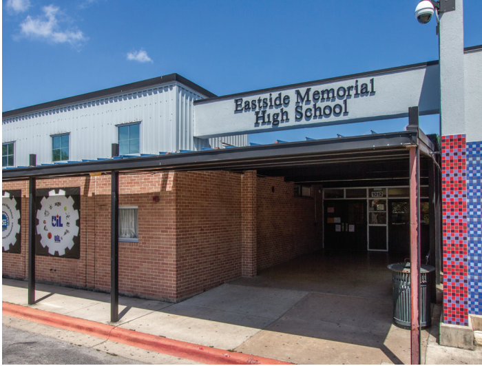
Eastside Memorial ECHS Campus